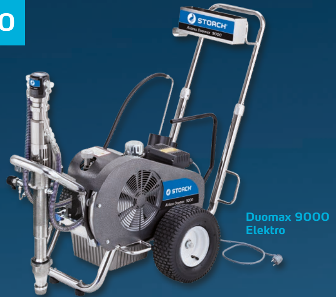
Duomax 9000 Elektro