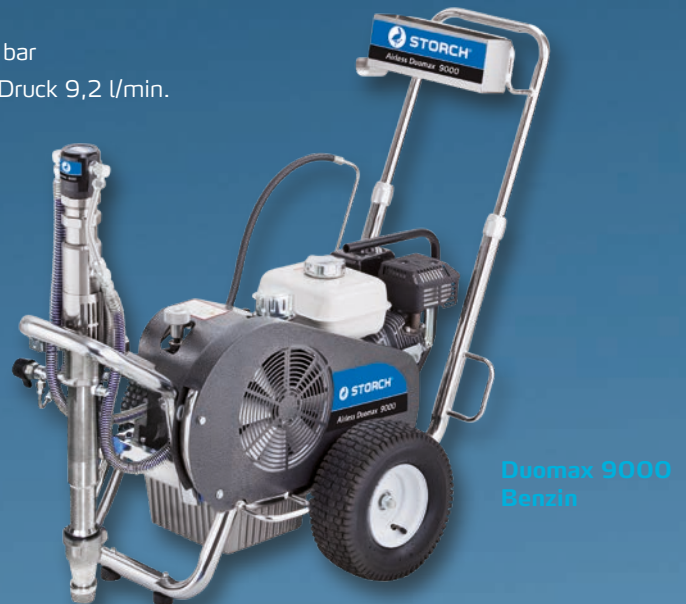
Duomax 9000 Benzin